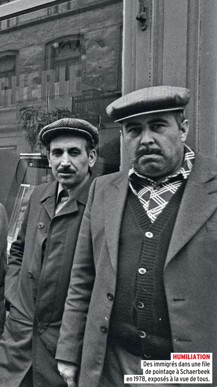
HUMILIATION Des immigrés dans une file de pointage à Schaerbeek en 1978, exposés à la vue de tous.