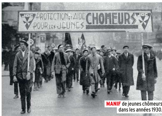
MANIF de jeunes chômeurs dans les années 1930.

Certains sans-travail, plus que d'autres, passent pour des tire-au-flanc professionnels. C'est le cas du jeune, sévèrement portraituré par l'Office national du placement et du chômage en 1939 : « Le degré d'intelligence des jeunes chômeurs est souvent trop bas et ils sont déjà tellement ancrés dans le découragement qu'il n'est pas possible de ne faire appel qu'à leur seule bonne volonté. [...] La contrainte doit donc suppléer